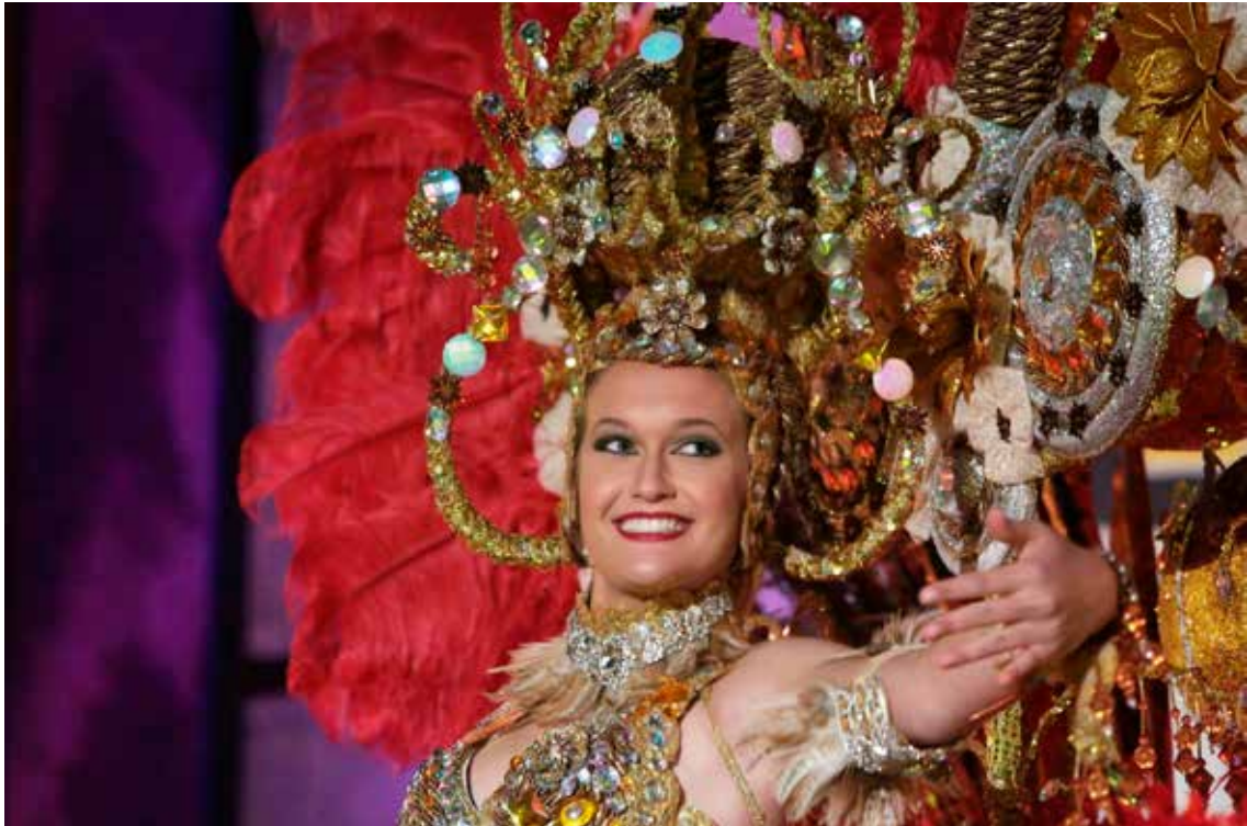
Comparsa en el desfile del carnaval.