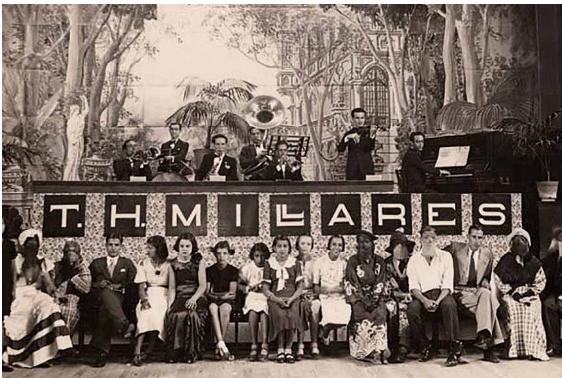
Baile de carnaval en el Teatro Hermanos Millares, en 1936.

Posteriormente se unieron Ingenio, Agaete y Gáldar. Como ejemplo recordar que, durante el período franquista, destacaban los bailes que se organizaban en la Sociedad Cultural (Casino) de Agüimes, que fue el primer municipio de Gran Canaria que sacó el carnaval a la calle con la celebración de la elección de la reina y la cabalgata, en 1966.