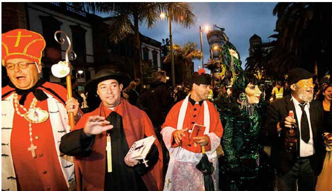
El comienzo de cortejo fúnebre se abre con curas y obispos disfrazados.

Actualmente, el entierro de la sardina es uno de los actos más populares del Carnaval y en Canarias cuenta con gran arraigo. En Gran Canaria son muy nombrados los entierros de Agüimes y de Agaete, donde el cortejo fúnebre es acompañado por murgas, comparsas y gran número de máscaras.