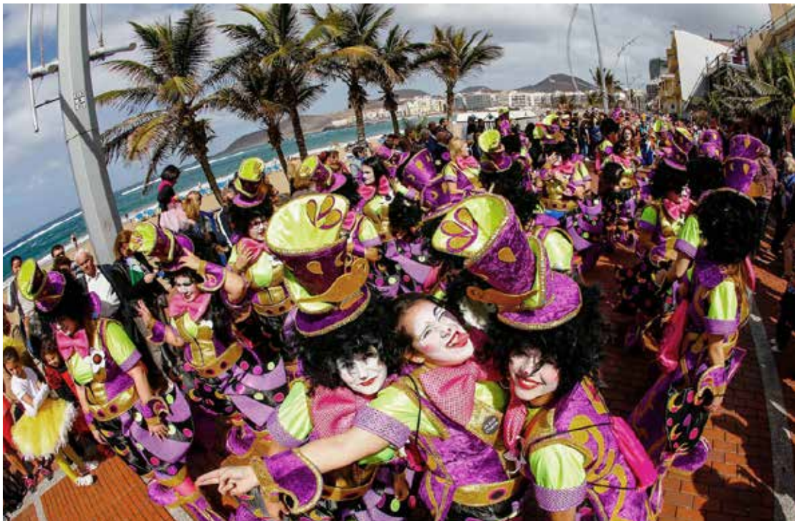
Murga actuando durante el concurso.