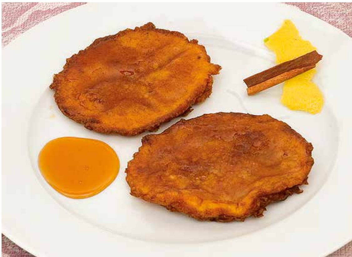
Tortillas de calabaza. Se servían con un poco de miel de caña.