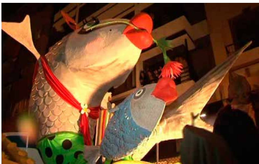
Entierro de una escuálida sardina en Agüimes.

En el fondo, este acto no es nada más que la representación de la tristeza de los carnavales a que finalice la fiesta del Carnaval y empiece la Cuaresma, que antaño era un periodo de ayuno y recogimiento espiritual y religioso dominado por la iglesia católica. Al terminar el desfile del acompañamiento, se incinera a la sardina en una pira mortuoria, con gran jolgorio y tristeza de los participantes.