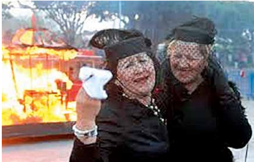
Desconsoladas viuditas lloran la incineración de la sardina.

El entierro de la sardina es una tradición que se remonta en el tiempo, de origen incierto, con diferentes interpretaciones: