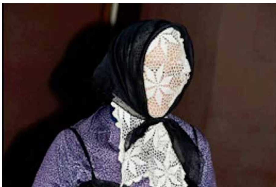
Mascaritas tradicionales en La Aldea.

En la actualidad, diferentes Ayuntamientos de la Isla, ante el abandono y desaparición del carnaval tradicional, están tratando de recuperar viejas costumbres carnavalescas, pues como se afirma en un artículo publicado en el periódico La Provincia: “aquellos de “¿me conoces mascarita?” prácticamente ha desaparecido, quedará en determinadas sociedades y poco más” .