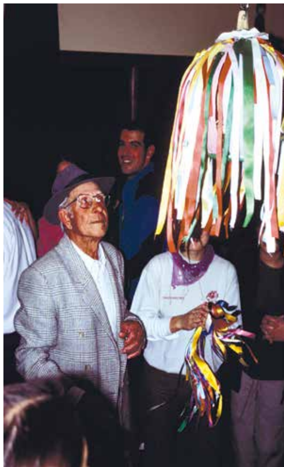
Una piñata en un baile en Tenerife.

Al final del baile se realizaba un juego que consistía en ir danzando al son de la música mientras las parejas se acercaban a la piñata y tiraban de una de las cintas. La pareja que conseguía romper la piñata, tirando de la cinta acertada, era la ganadora, entre las risas y el jaleo de los participantes, pues había abierto el recipiente lleno de caramelos y chucherías, donde caía harina y polvos de talco.