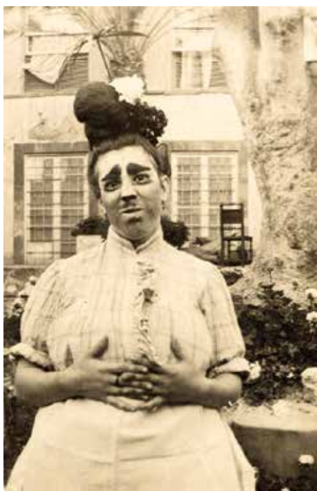
Mascarita popular (Rosario de Castro, 1930).

El pueblo todo, desde las clases menesterosas hasta las más ricas, tomaba parte activa en estas expansiones, sin que el orden se alterase, ni dominara la embriaguez. A las doce de la noche del martes, toda la ciudad quedaba súbitamente en sepulcral silencio. La Inquisición vigilaba”.