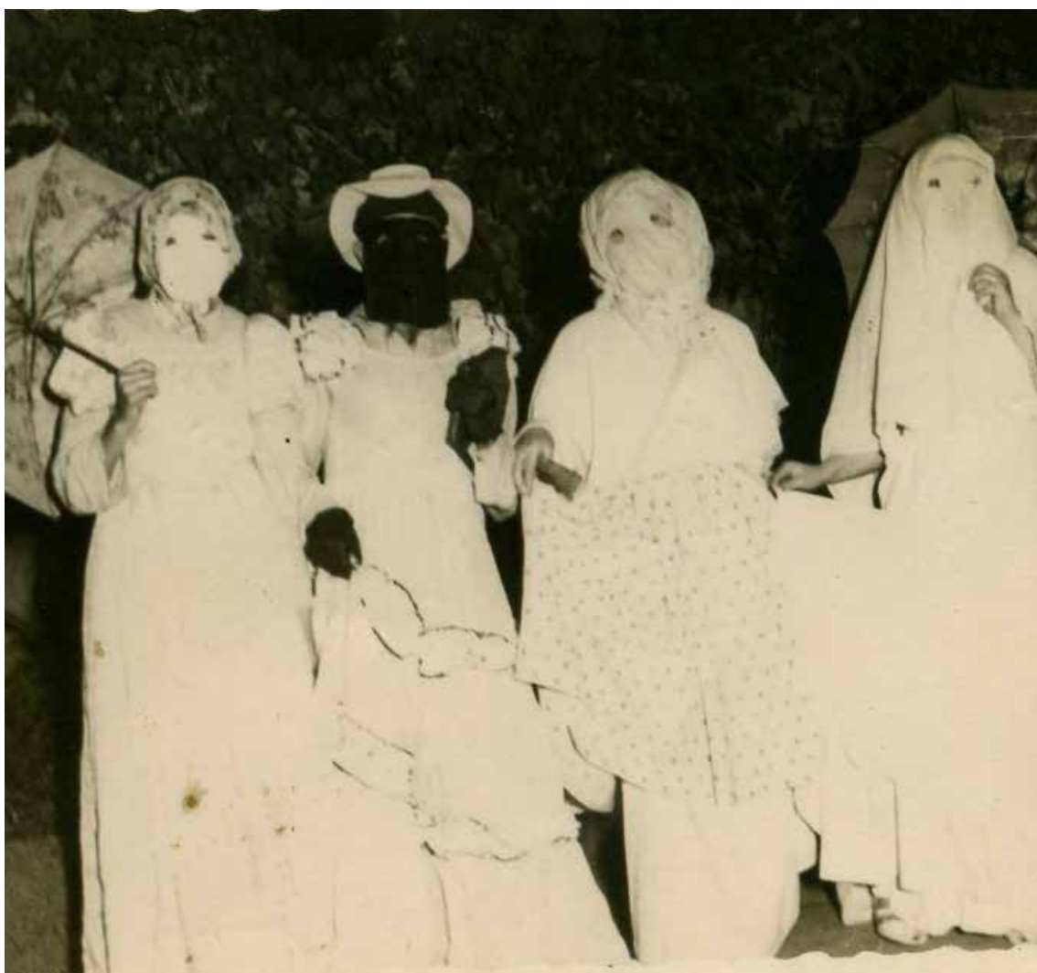
Mascaritas con disfraces hechos con sábanas viejas.

b- Los hombres , se disfrazaban frecuentemente de mujer usando faldas, trajes, blusas, colchas, manteles, sábanas viejas, cojines, medias rotas, calcetines, pañuelos o sombreros en la cabeza..., se podían tapar la cara igual que las mujeres o dejarla al descubierto. Ambos solían imitar la voz del sexo opuesto para no ser reconocidos. Alguna “mascarita” solía vestir con la ropa al revés, para que pareciera que caminaba hacia atrás.