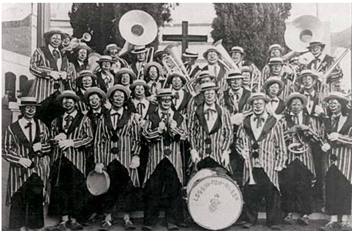
Murga los “sin-ton-ni-son”, de la Villa de Agaete en 1969.

Las murgas proceden de las chirigotas gaditanas, pero después de noventa años, la chirigota gaditana, la murga canaria y la murga uruguaya son agrupaciones muy diferentes en todos los aspectos: musicalmente, en número de componentes y en estructura de las canciones.