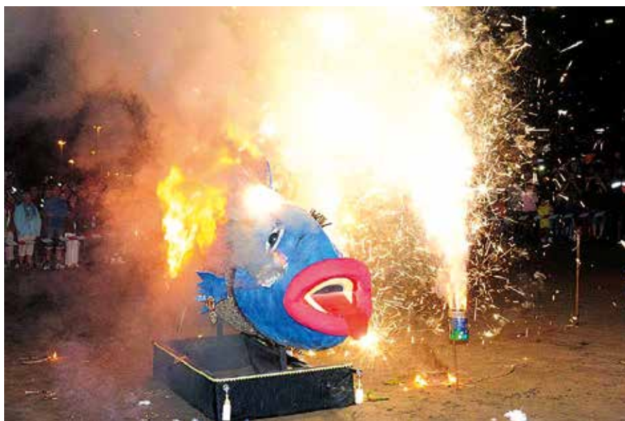
El catafalco mortuario en el entierro de la sardina de Agüimes.