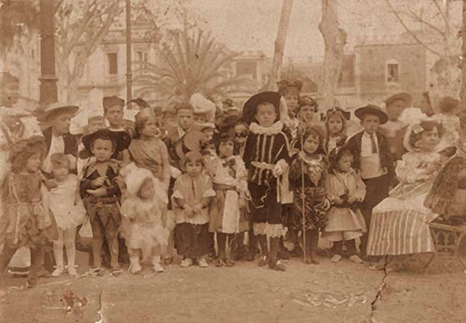
Carnaval infantil en Las Palmas de Gran Canaria, alrededor de 1919.