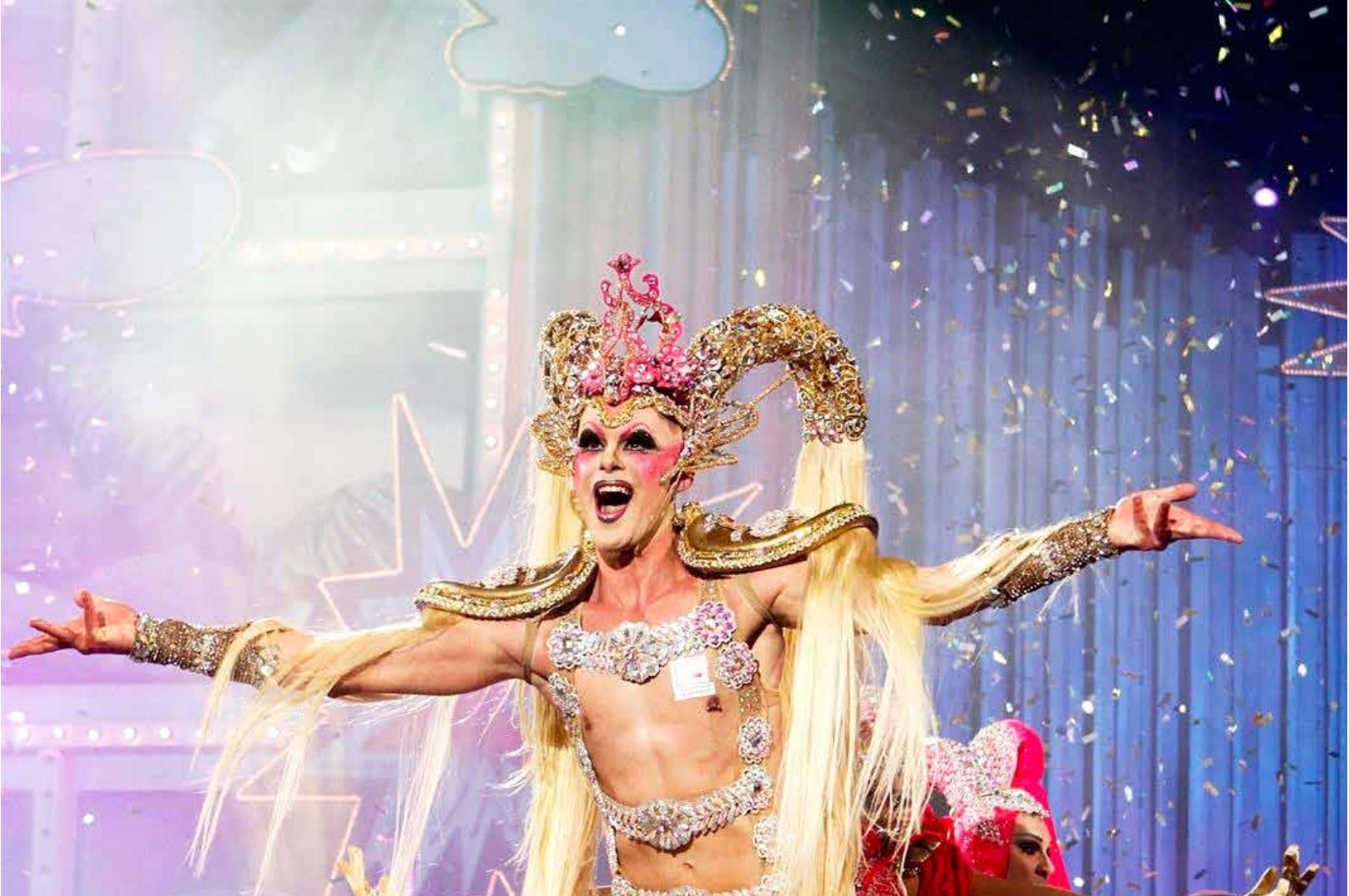
Drag Queen durante una gala del carnaval.