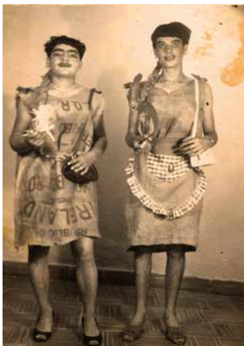
Mascaritas de La Isleta, alrededor de 1965.

a- Las mujeres se disfrazaban frecuentemente de hombres usando camisa, pantalón, corbata, chaqueta, chaleco y sombrero. La cara la tapaban con una talega blanca, a la que se le hacían cortes a la altura de los ojos, nariz y boca. También podían ocultar su rostro con un velo o un antifaz.