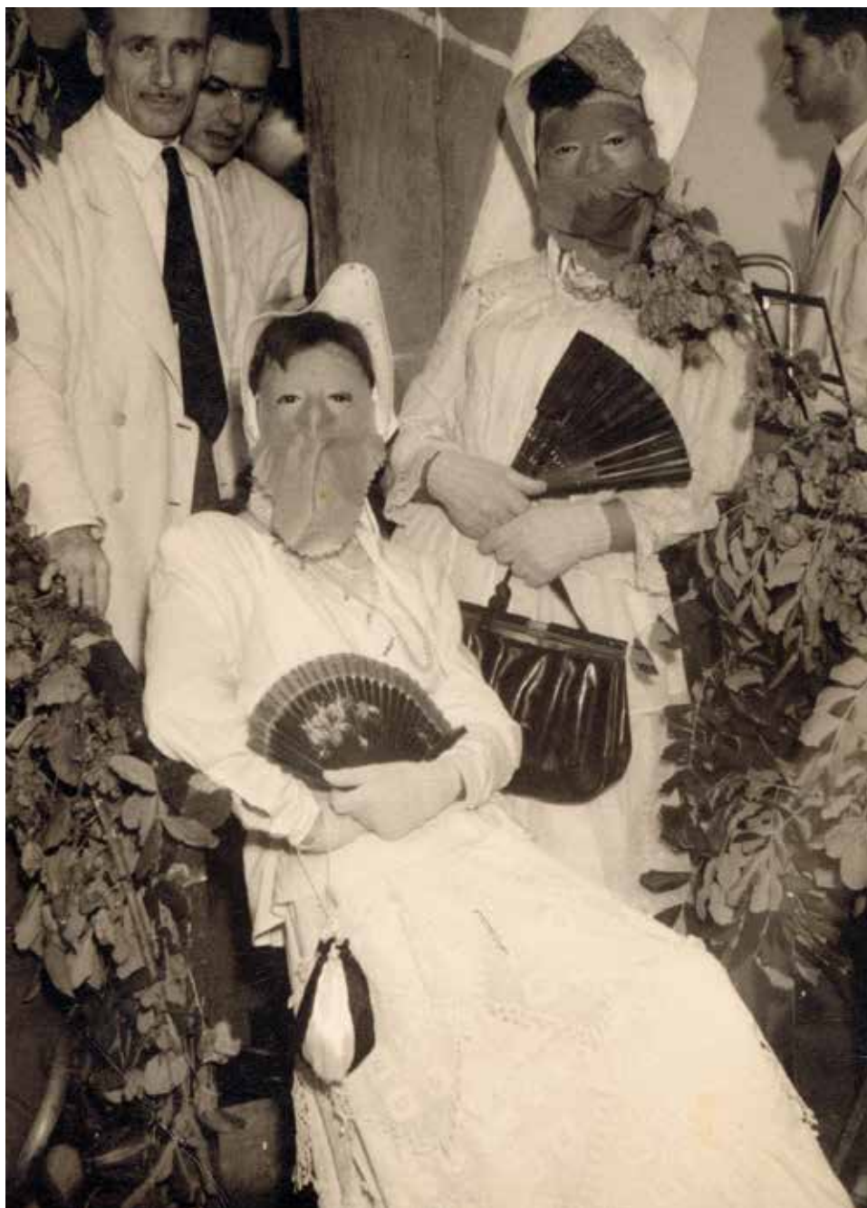
Dos mascaritas en un baile de sociedad, sobre 1950.

Estas antiguas costumbres se siguen celebrando en la Aldea de San Nicolás, donde los niños se disfrazan con pieles y cuernos de cabra haciéndose pasar por ganado y acompañados por un pastor corren por las calles del pueblo, o en los barrios de La Pardilla o en el Lomo Magullo, en Telde, donde se celebra un baile de mascaritas el último domingo de carnaval, el domingo de piñata.